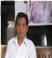
Pu Thawng Kho Thang